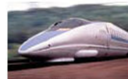
Shinkansen (Bullet train)