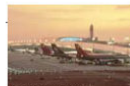
Kansai International Airport